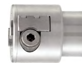
MANDRINO WESCOTT 0-20 mm

Il bloccaggio pneumatico a pedale rende comode e rapide le operazioni di carico e scarico dei pezzi e assicura un fissaggio ottimale durante la lavorazione.