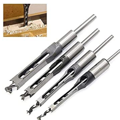
PREDISPOSIZIONE PER LAVORAZIONI CON PUNTE QUADRE A BEDANO

Il bloccaggio pneumatico a pedale rende comode e rapide le operazioni di carico e scarico dei pezzi e assicura un fissaggio ottimale durante la lavorazione.