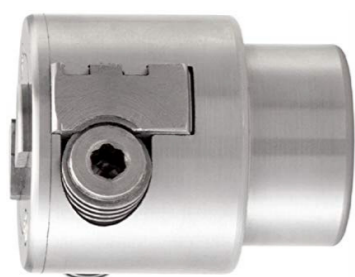
MANDRINO WESCOTT 0-20 mm

La tavola inclinabile -45° / +45° consente di eseguire ogni tipo di lavorazione in piena comodità e sicurezza.