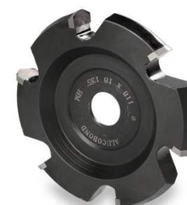
FRESA PER ALUCOBOND