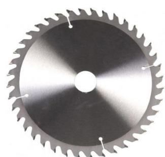
LAMA PER LEGNO