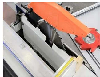
LAMA PER ALLUMINIO